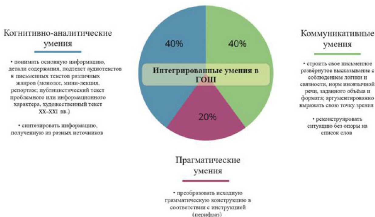
Рис. 1. Типология интегрированных умений