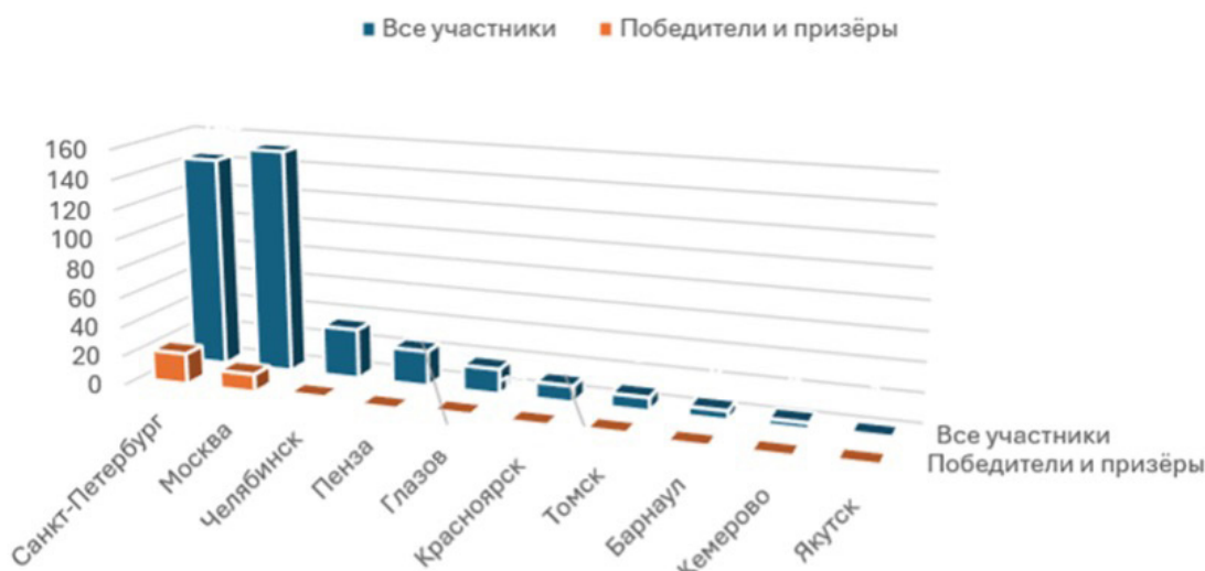
Рис. 3. География участников заключительного этапа ГОШ по английскому языку

Обобщая социально-демографические данные об участниках заключительного этапа ГОШ по английскому языку, отметим, что типичным победителем и призером олимпиады в 2024/25 учебном году была обучающаяся 11-го класса, проживающая в Санкт-Петербурге.