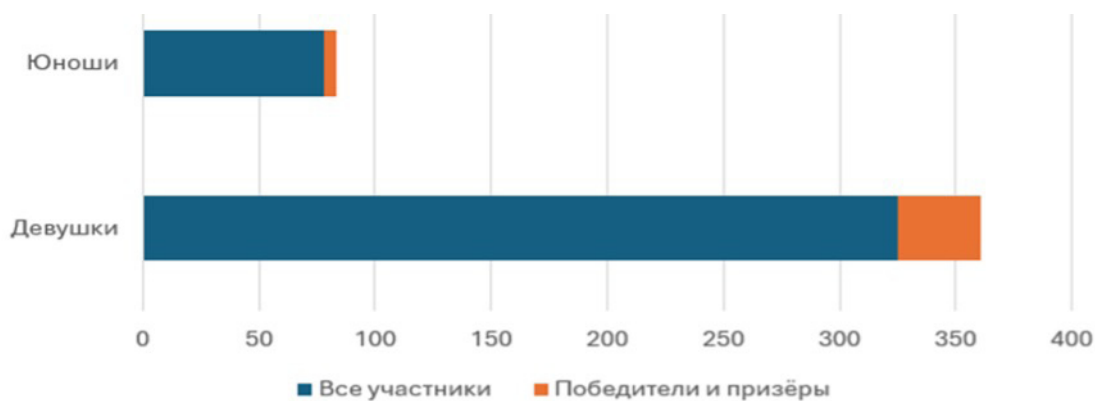
Рис. 2. Гендерный состав участников заключительного этапа ГОШ по английскому языку