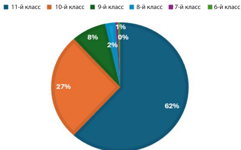
Рис. 1. Возрастные характеристики участников заключительного этапа ГОШ по английскому языку

Представляя гендерный состав участников заключительного этапа ГОШ по английскому языку, отметим, что 80,6 % участников — это девушки (325 человек), а юноши (78 человек) составляют 19,4 % от общего числа конкурсантов. Победителями и призерами стали 36 девушек и 5 юношей (87,8 и 12,2 % соответственно). Выскажем предположение, что эта тенденция объясняется гуманитарной лингвистико-педагогической направленностью олимпиады (рис. 2).